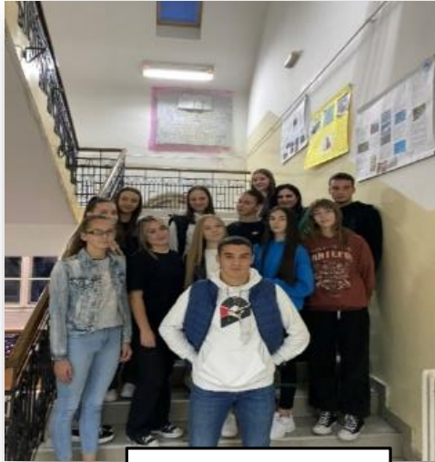
Ученици одељења 2е