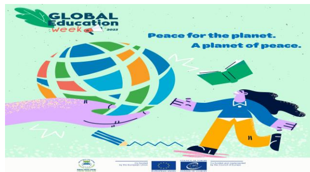
Лого Недеље глобалног образовања

Поред Захвалнице, активности професора су званично унете као репрезентативни и квалитетни примери на сајт Савета Европе. На овај начин смо постали део ширег, интернационалног, оквира који је препознао квалитет идеја и наставних активности професора и ученика Економске школе.